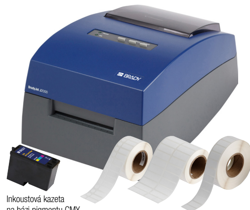
Inkoustová kazeta na bázi pigmentu CMY pro tiskárnu J2000