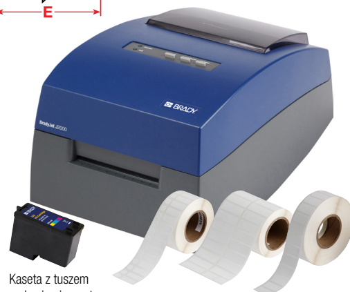
Kaseta z tuszem na bazie pigmentu CMY do drukarki J2000