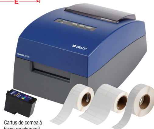
Cartuș de cerneală bazat pe pigmenți CMY pentru imprimanta J2000