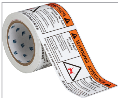
4" x 6" Riesgo de arco eléctrico