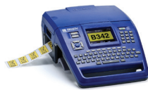
Impresora de etiquetas BMP®71