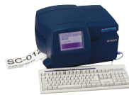
Etiquetadora industrial GlobalMark®