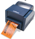
Etiquetadora Industrial MiniMark™