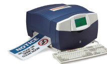
Impresora de señalamientos y etiquetas PowerMark®

Para obtener más información, visite www.BradyLatinAmerica.com o llame al 01-800-262-7777.