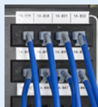
Communications voix et données