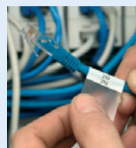
Etiquettes et manchons pour marquage de fils