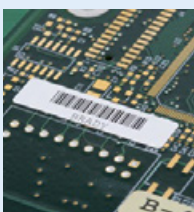
Etiquettes de circuits imprimés