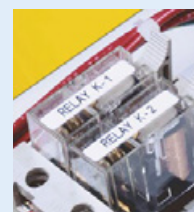
Etiquettes à usage général