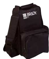
Lehká přenosná brašna