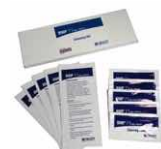
Kit di pulizia