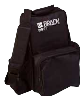
Mala de transporte flexível