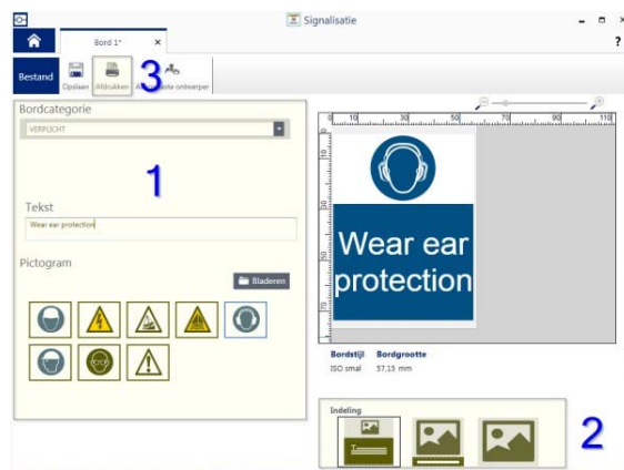
Figuur 2: Stap 2