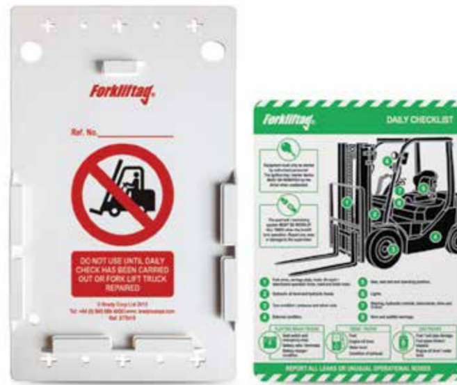
Das visuelle Kennzeichnungssystem Forkliftag® von Brady

Zur Verbesserung der Sicherheit und der Informationsvermittlung bei Verwendung von Gabelstaplern bietet Brady das visuelle Kennzeichnungssystem Forkliftag® an, das Unternehmen bei der Kontrolle von schichtvorbereitenden Inspektionen, Wartungsarbeiten und bei einer angemessenen Kennzeichnung von Gabelstaplern unterstützt.