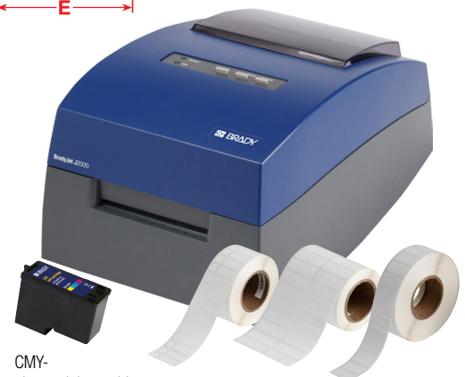
CMY-pigmentinkcartridge voor J2000-printer