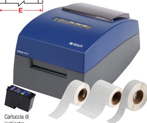
Cartuccia di inchiostro pigmentato CMY per stampante J2000