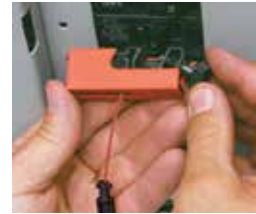
2. Coloque el dispositivo de bloque en el interruptor y póngalo en posición de bloqueo.