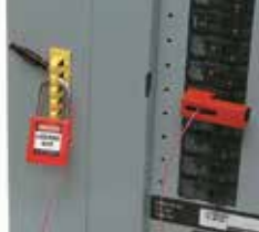
3. Pase la llave de plástico a través de el riel para bloqueo y coloque el candado, evitando que la llave se deslice hacia abajo y que se abra el dispositivo.