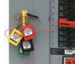
4. Para bloqueos grupales, corra la llave en múltiples aros en el riel de bloqueo y aplique los candados. No se requieren broches. (No se recomienda para uso con broches de bloqueo múltiple)