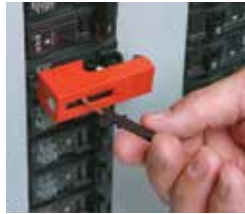
El dispositivo se desbloquea insertando y girando la llave negra de plástico.