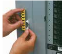
1. Exponga el adhesivo en la parte trasera del riel. Fije de manera permanente en cualquier ubicación del panel.