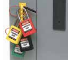
5. Bloqueos de perfil bajo, permiten que las puertas de los paneles se cierren en la mayoría de los paneles de interruptores.