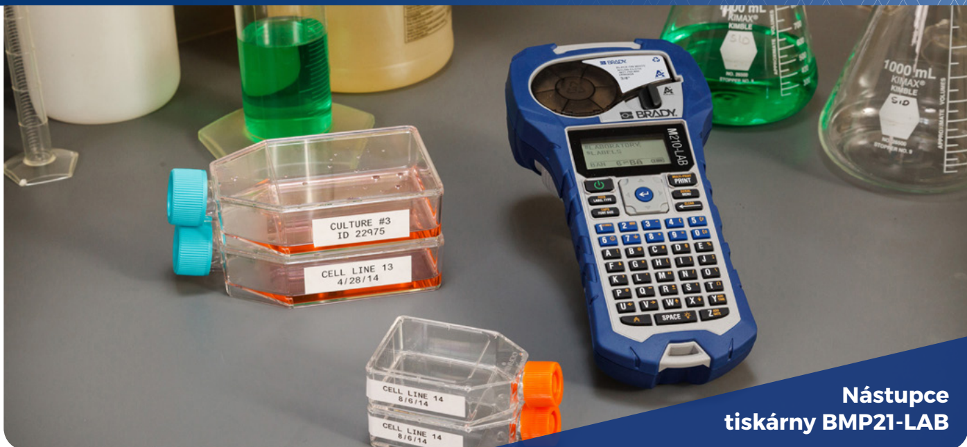
Nástupce tiskárny BMP21-LAB