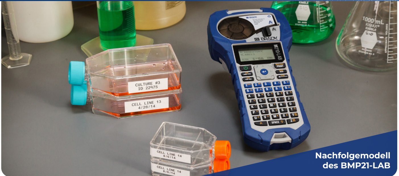
Nachfolgemodell des BMP21-LAB

MAXIMALE EFFIZIENZ IN KOMBINATION MIT HÖHERER QUALITÄT