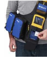
Sac de transport