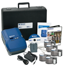
*Se muestra el kit de la BMP53