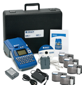
*Se muestra el kit de la BMP51