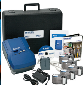
*Se muestra el kit de la BMP53