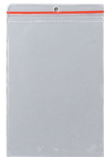
Sobre con cierre