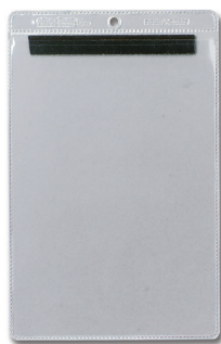
Sobre con soporte magnético - Abierto