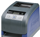
Impresora de etiquetas BBP®33

Ahorre tiempo usando la función de lista que le permite exportar información de activos y de cables desde NetDoc a un archivo CSV. Coloque el archivo CSV en una unidad USB para importar los datos en la BMP61 para crear etiquetas rápidamente.