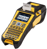
Impresora de etiquetas BMP®61

Ahorre tiempo usando la función de lista que le permite exportar información de activos y de cables desde NetDoc a un archivo CSV. Coloque el archivo CSV en una unidad USB para importar los datos en la BMP61 para crear etiquetas rápidamente.