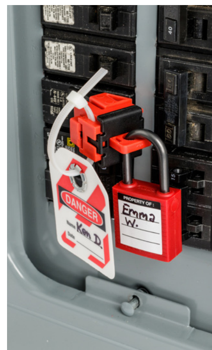
Modèle à vis