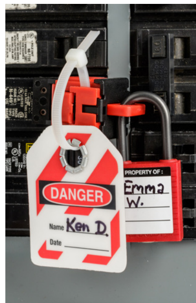
Peut être scellé avec des colliers de serrage et/ou un cadenas