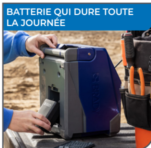
BATTERIE QUI DURE TOUTE LA JOURNÉE