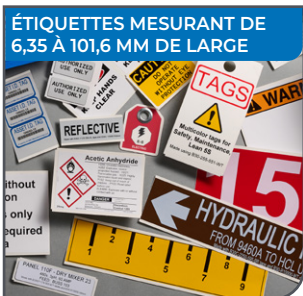
ÉTIQUETTES MESURANT DE 6,35 À 101,6 MM DE LARGE