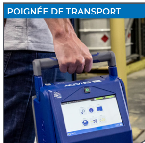
POIGNÉE DE TRANSPORT